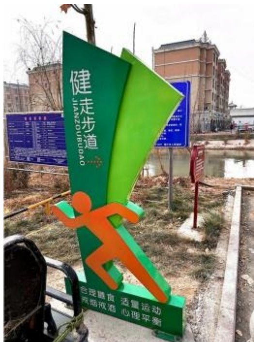
图 3：运动标识 1