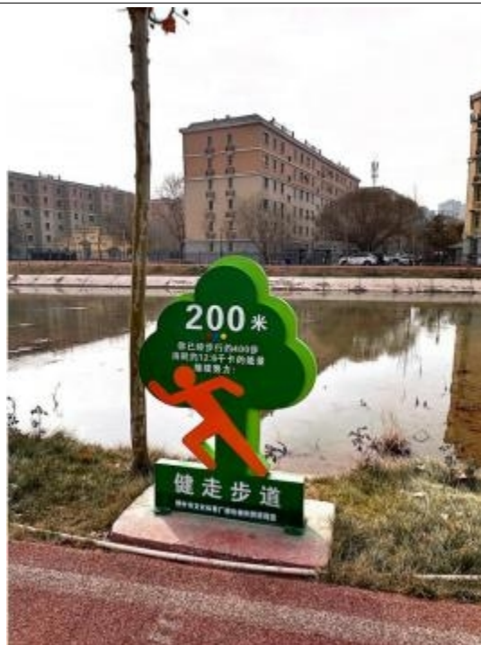
图 4：运动标识 2