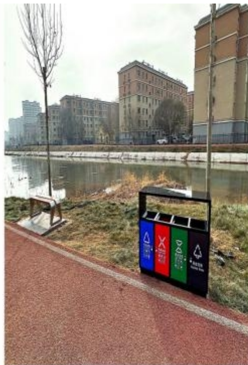
图 2：休闲座椅、垃圾箱